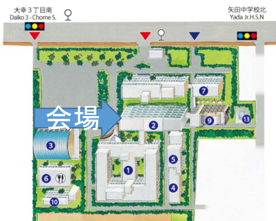
○配置図(大幸キャンパスマップ)